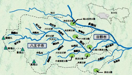
2016年9月 八王子・日野カワセミ会