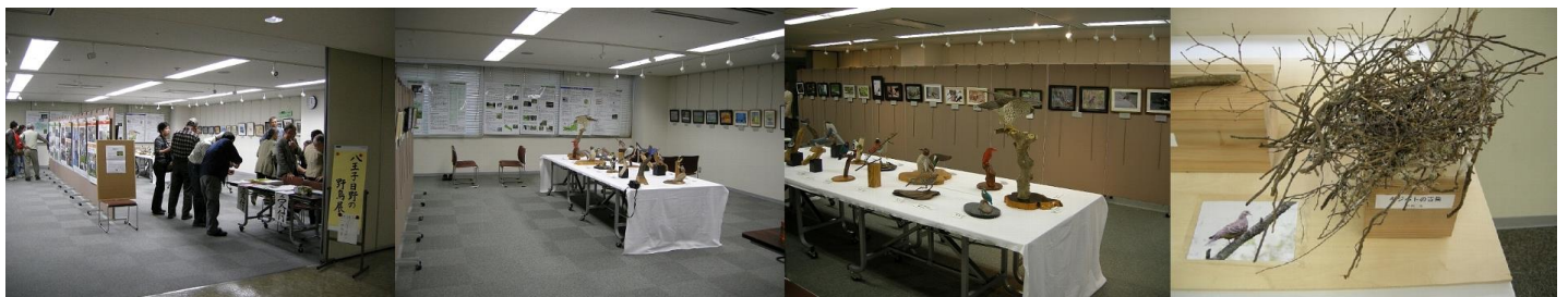
前回（2011年）野鳥展の様子